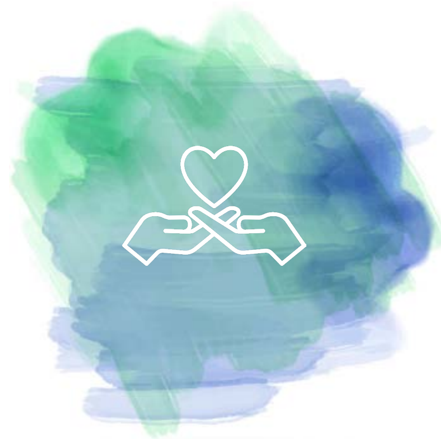
Ondersteuning in de wijk